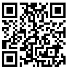
中小学校长网络研修项目